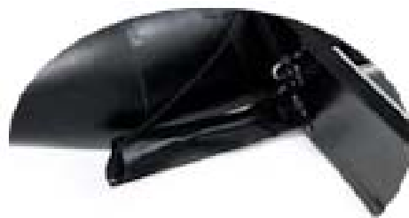
Vide-vite grande capacité Sécurité