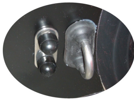
Points de Levage et Remorquage Manœuvre