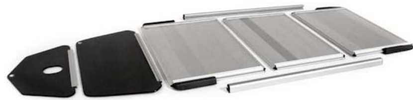
Plancher Rigide Amovible Robustesse / Stockage / Maintenance