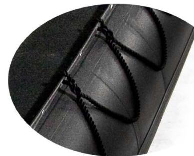
Ligne de Vie Extérieure Sécurité