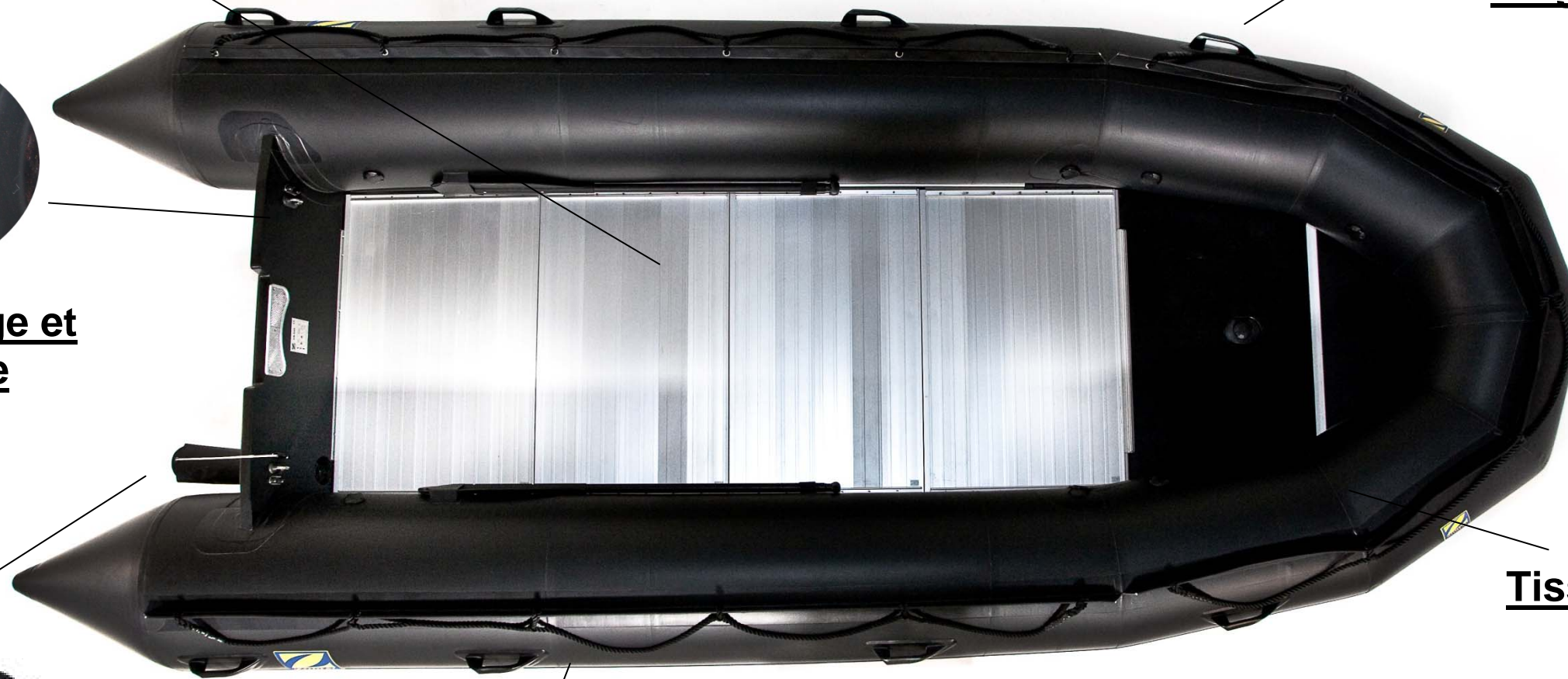
Tissu CSM / Néoprène Zodiac Milpro Résistance