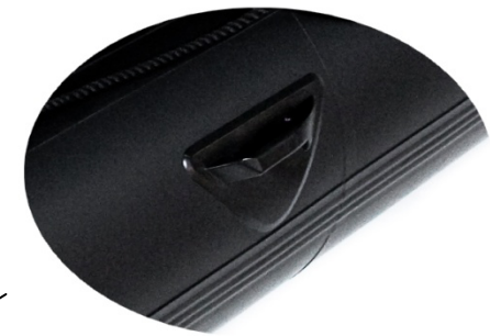
Poignées de Levage Ultra-mobilité