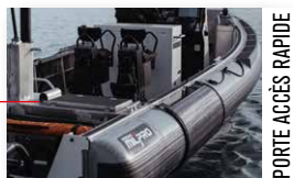
PORTE ACCÈS RAPIDE